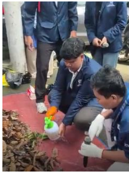
Gambar 3. menyemprotkan perlahan agar sampah kering bagian atas terkena merata