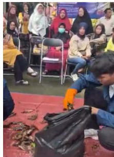
Gambar 5. memasukan sampah kering yang telah diberi treatment