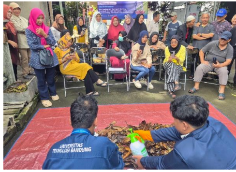
Gambar 4. menyemprotkan bagian atas sampah secara merata