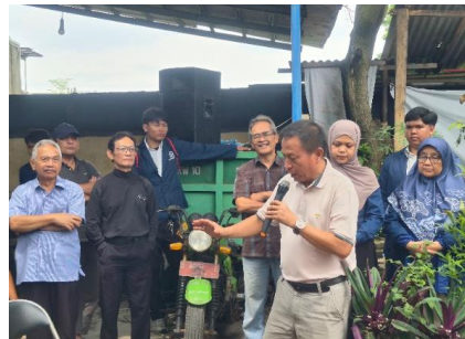
Gambar 6. perwakilan warga peserta memperagakan pengolahan sampah

Gambar nomor 3 memperlihatkan proses praktik pembuatan kompos yang dilakukan oleh peserta kegiatan pengabdian. Pada tahap ini, peserta sedang melakukan penyemprotan larutan aktivator ke tumpukan sampah organik secara perlahan agar bagian permukaan yang kering dapat terbasahi secara merata. Proses pembasahan ini merupakan langkah penting dalam pengomposan karena kelembapan yang cukup akan mempercepat aktivitas mikroorganisme pengurai. Kegiatan dilakukan secara langsung oleh peserta dengan pendampingan tim pelaksana untuk memastikan teknik yang digunakan sudah sesuai dengan prosedur. Melalui praktik ini, peserta memperoleh pengalaman nyata mengenai tahapan pengolahan sampah organik menjadi kompos yang baik dan benar.