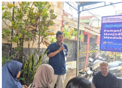
Gambar 2. Pemaparan materi

Kegiatan dilanjutkan dengan pelatihan pembuatan pemanfaatan sampah kering menjadi pupuk kompos untuk mendukung pertanian berkelanjutan dari penentuan peralatan seperti terpal yang digunakan, selanjutnya dengan meletakkan sampah daun kering di atas terpal, dihamparkan diatas terpal, selanjutnya membuat resep penguraian dan fermentasi sampah, dengan cara mengisi ember dengan 10 liter air, ditambahkan 5x tutup EM4, ditambahkan gula \frac{1}{4} kg, diaduk hingga rata. Kemudian disemprotan ke sampah kering secara merata. Setelah semua sampah basah, sampah dimasukkan ke dalam karung dan diikat kuat. Terakhir sampah disimpan pada tempat yang kering dan dibiarkan selama 1 bulan. Setelah sebulan sampah siap digunakan untuk pupuk kompos untuk mendukung pertanian berkelanjutan. Output yang dihasilkan dari kegiatan ini, warga masyarakat dapat memahami dan mempraktikkan keterampilan pengolahan sampah yang telah dipelajari. Adapun dokumentasi kegiatan pada pertemuan ini adalah sebagai berikut: